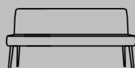
Typ Nr SO02 Sofa 2 – siedzeniowa