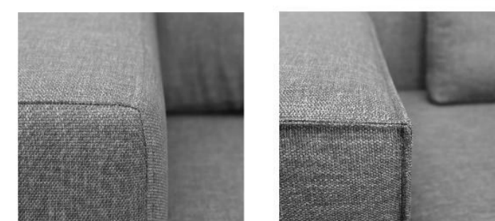
Szew Zamknięty Szew Otwarty